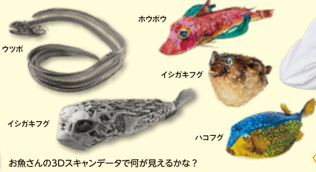
お魚さんの3Dスキャンデータで何が見えるかな？