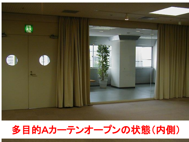
多目的Aカーテンオープンの状態(内側)