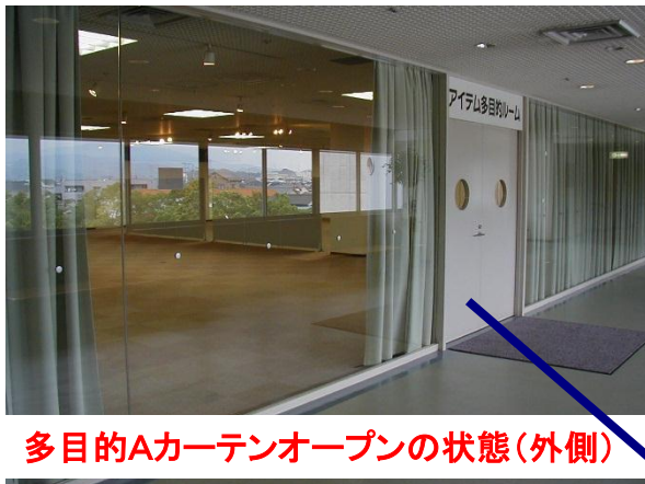
多目的Aカーテンオープンの状態(外側)

多目的ルームは3階にあり、搬入は人用エレベーターを経由する経路のみです。長尺物、重量物は搬入が困難な場合がありますので事前にご相談ください。