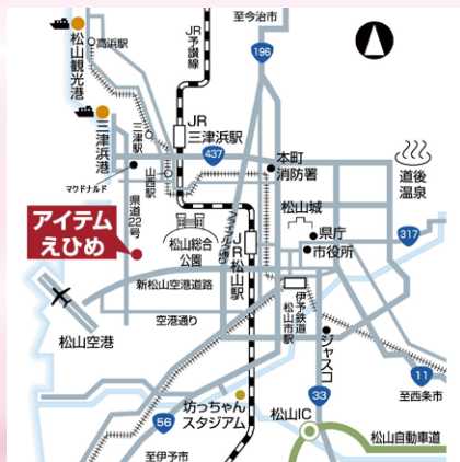
交通費・駐車場費等はお客様負担となります

場所 アイテム愛媛 小展示場 A 〒791-8057 愛媛県松山市大可賀 2丁目 1-28 TEL 089-951-1211